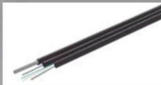
Cabo Drop Fig.8 -LOW FRICTION