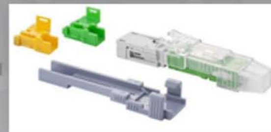
Conector de Campo - Kantan